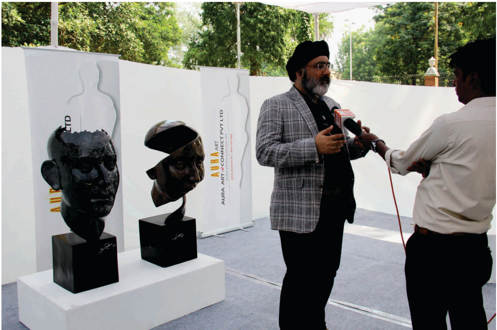
Media interaction in Sculpture Zone