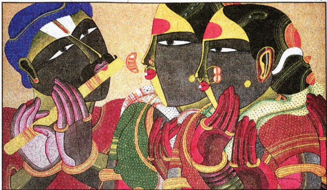
Total 45 artists will be exhibited at Fine Arts Faculty, MSU

"I have lived in this city for over 15 years. But I have