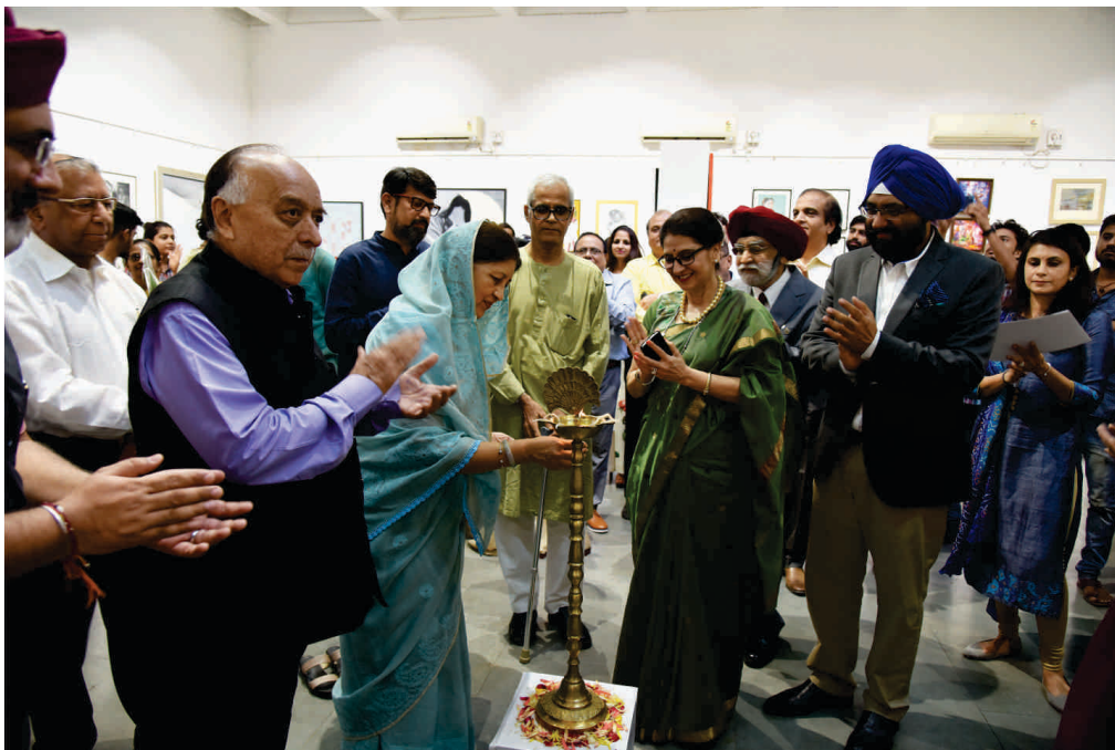
Chief Guest Respected Rajmata Shubhanginiraje Gaekwad ji lighting the traditional lamp along with Guests of Honour