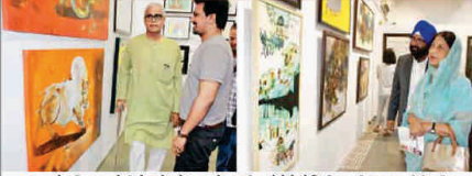
કલાકારો સમિત કરવા પ્રેમીઓ અને શહેરના અનેક જાણીતા લોકોએ એક્ઝિબિશનની મુલાકાત લીધી હતી.